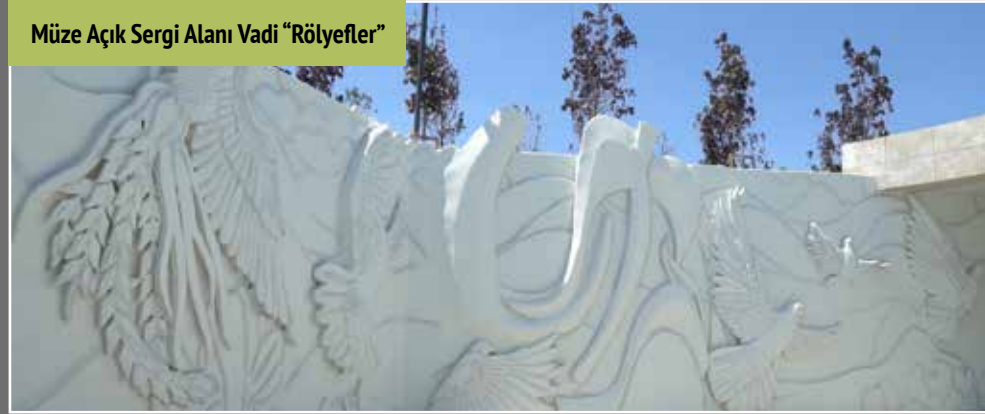
Müze Açık Sergi Alanı Vadi "Rölyefler"