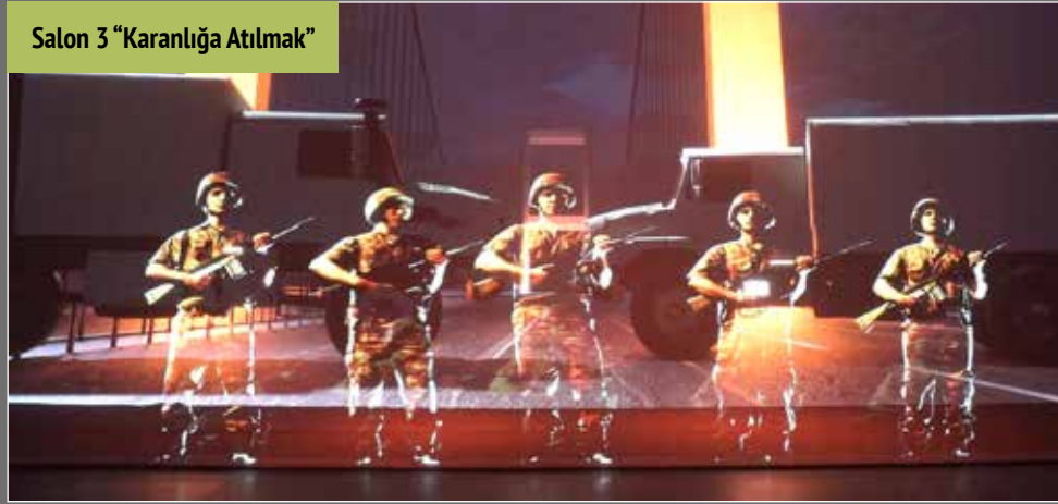
Salon 3 "Karanlığa Atılmak"