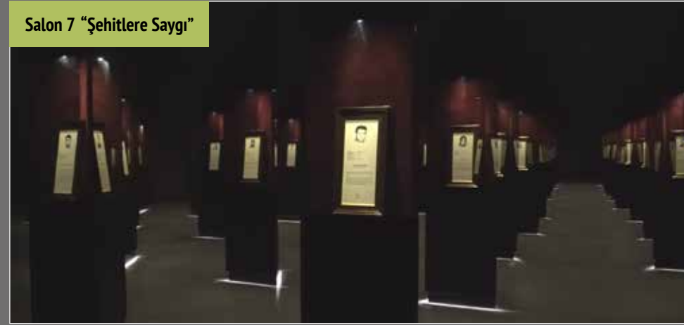
Salon 7 "Şehitlere Saygı"