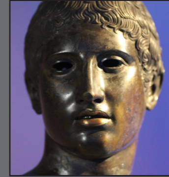
Genç Atlet Heykeli

Bu ünik eser, marakes olarak isimlendirilen enstrümanın atası olarak kabul edilmektedir. İkiztepe Höyüğü'nden elde edilen buluntu pişmiş toprak malzemeden imal edilmiştir.