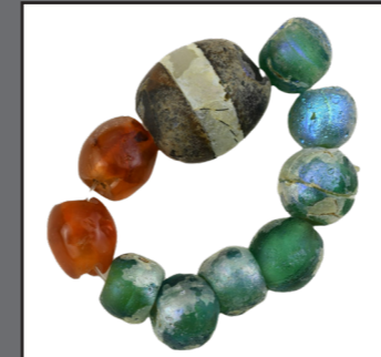
Hellenistik Dönem Cam Kolye

Genç atlet heykeli, Roma Döneminde vücut hatları tamamen dökme bronz kalıba işlenerek yapılmış olan heykelin dişleri gümüştür. Heykel müzenin ünik eserlerindedir.