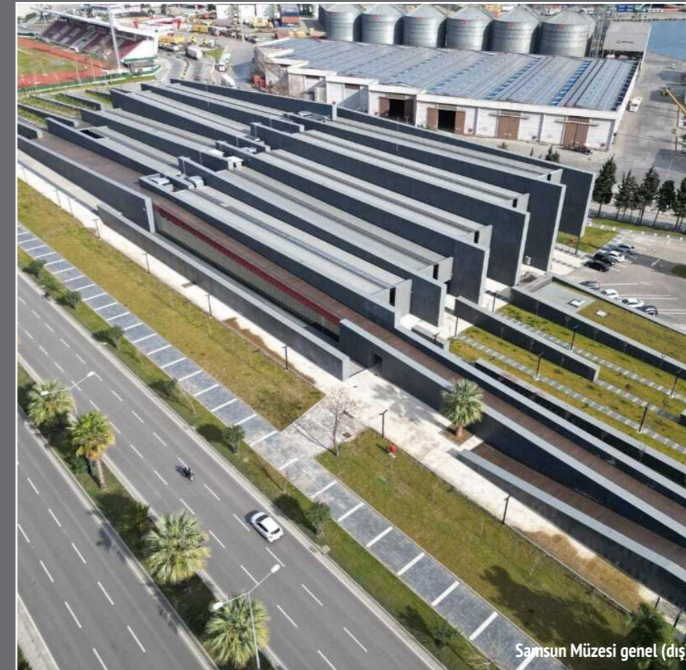
Samsun Müzesi genel (dış)