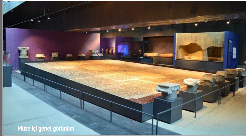
Müze içi genel görünüm

Samsun Müzesi ve teşhir salonları, Bakanlığımızca 13 Mart 2024 tarihinde ziyarete açılmış olup 9 tane teşhir salonu (Arkeoloji 1-2-3-4, etnografya 1-2...vb) ve 7 tane etkinlik alanından oluşmaktadır. Milyonlarca yıl öncesine tarihlenen fosillerle başlayan teşhir salonu daha sonra yaşam izleri Üst Paleolitik Dönem'e dek uzanan Tekkeköy Mağaraları'na ait diorama ile devam ederek tarih öncesi dönemlere ait eserlerin bulunduğu salondan tarih çağlarının başladığı teşhir salonuna geçilmektedir.